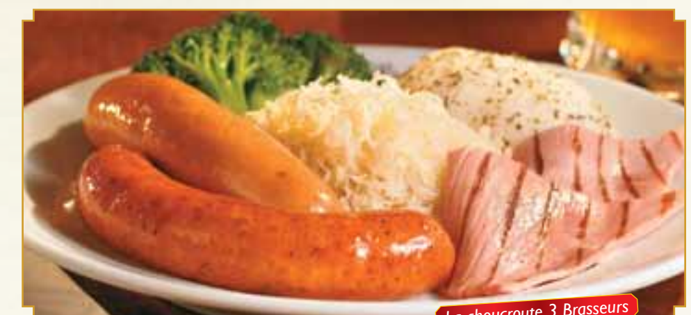
La choucroute 3 Brasseurs