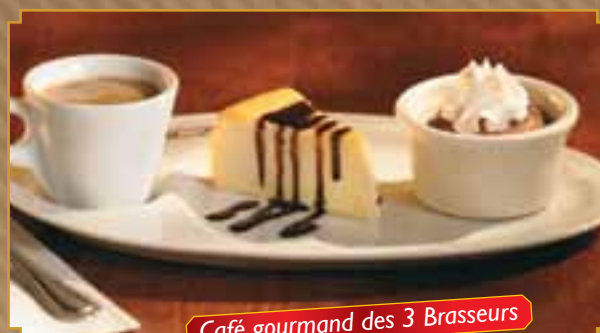
Café gourmand des 3 Brasseurs