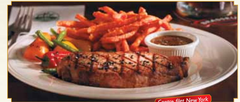
Contre filet New York