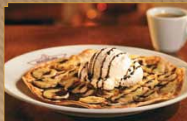
Flamm banane, chocolat et crème glacée vanille